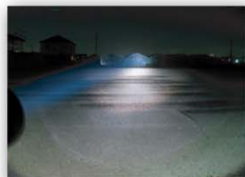
(HIDライト) ビニールハウスまで明るく照射しています。