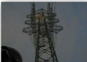
(ハロゲンライト) 照射されてるのが、何となく分かる程度です。