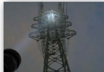
(HIDライト) 鉄塔上部まで明るく照射しています。