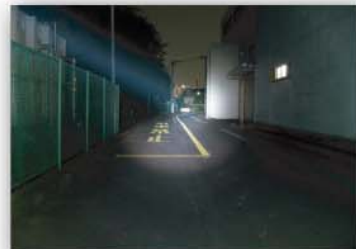
(HIDライト) はっきりと被写体や路面を映し出します。