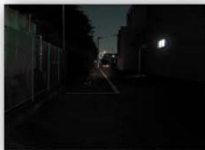
(ハロゲンライト) 被写体をやっと確認できました。